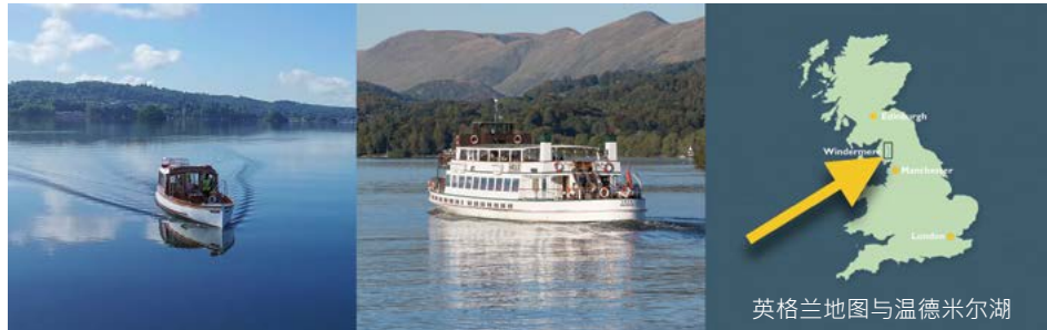
英格兰地图与温德米尔湖

您可以坐着游轮欣赏附近的美景，游轮的航行时间从45分钟到3小时不等，适合各种年龄的旅客，可以穷游，也可以尽情享受。带着您的客人一起来吧！一艘游轮，一处美景，当地酒店的精致午餐，和轻松悠闲的下午茶。即使时间飞逝，多年以后，这一天仍会在你们的记忆中鲜活闪耀。无论是几个小时，还是一整个周末，我们都可以为您和您的旅伴设计出理想的行程计划。